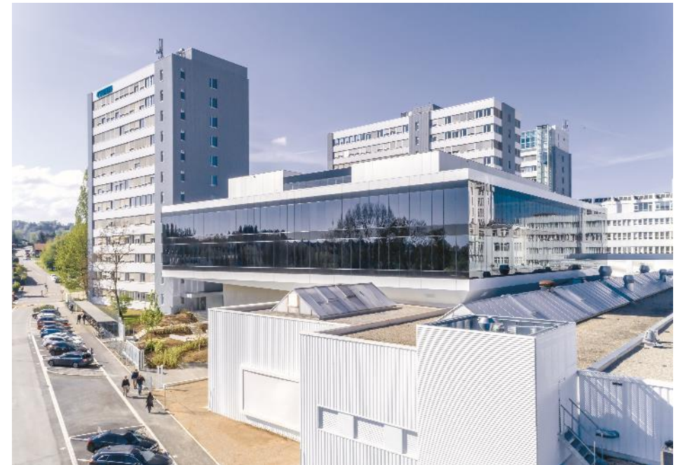
Bühler Hauptsitz mit Innovationszentrum CUBIC in Uzwil